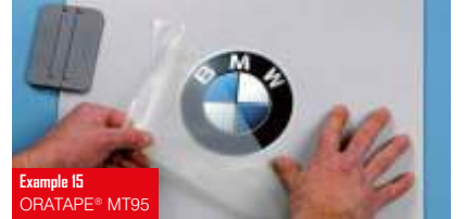
Example 15 ORATAPE® MT95

Şeffaf, Polietilen bazlı ve tırtıklı yüzeyli transfer folyosu Orta tutkal gücü ve sökülebilir poliakrilat tutkal Mat veya parlak tüm folyo tiplerinde, ıslak veya kuru uygulama için uygun