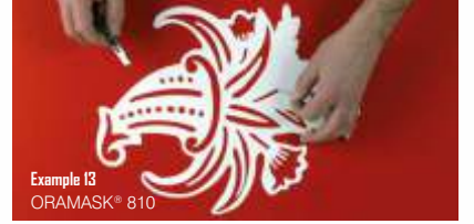
Example 13 ORAMASK® 810

Translusen gri şablon folyosu (Özel PVC, 80 mikron) Mat bitişli Düz veya pürüzlü yüzeylerde, tüm boyama ve spreyci boyama teknikleri için ideal Poliakrilat, sökülebilir