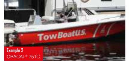
Example 2 ORACAL® 751C

Cast PVC folyo, yalnızca 60 mikron 117 parlak renk + mat siyah / mat beyaz Üstün dayanıklılık ve perçin ve oluklarda üstün boyutsal kararlılık Uzun vadeli dış mekan uygulamaları Solvent poliakrilat, kalıcı Alman onayı: ABG (StVZO §22a) Yüksek kalite araç ve toplu taşıma reklamları için ideal DIN EN 13501-1