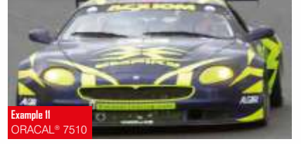
Example 11 ORACAL® 7510

Floresan Cast PVC folyo (170 mikron) RapidAir®teknolojisi ile uygulamacı, folyo ile yüzey arasındaki hava kabarcıklarını kolayca çıkarır ve daha hızlı bir uygulama gerçekleştirir. 2 parlak renk seçeneği / Gün ışığında yoğun floresan parlaklığı Solvent poliakrilat, kalıcı / Öngörülen maksimum hizmet süresi: 3 yıl