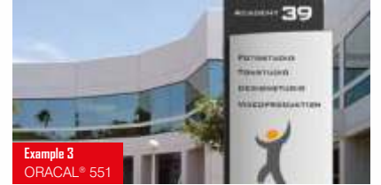
Example 3 ORACAL® 551

Yüksek performans PVC folyo (70 mikron) 98 parlak renk + mat siyah / mat beyaz Üstün boyutsal kararlılık ve kolay uygulama Uzun vadeli dış mekan uygulamaları Solvent, poliakrilat, kalıcı Alman onayı: ABG (StVZO) Yüksek kalite araç ve toplu taşıma reklamları için ideal