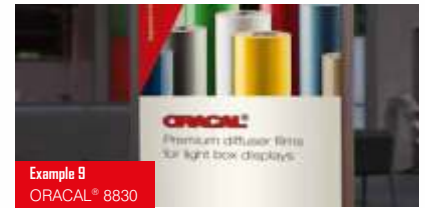
Example 11 ORACAL® 8830

%30 ışık geçirgenliği ile ışığı dağıtan transludent, beyaz ve mat özel cast PVC folyodur. Yüzeyde azaltılmış parlaklık istenmeyen ışık oyunlarını engeller.