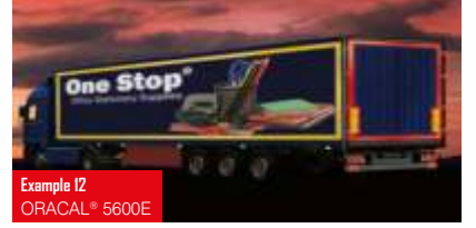
Example 12 ORACAL® 5600E

Cast PVC bitişli reflektif folyo (RA1, design A, 110 mikron) 11 RENK SEÇENEĞİ / Oluklara ve perçinlere uyumlu ECE 104 sınıf E onaylı / Dayanıklılık: 7 yıl Solvent poliakrilat, ısı ile sökülebilir