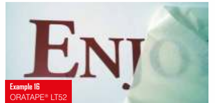
Example 16 ORATAPE® LT52

Mt52 Yarı-Şeffaf transfer kağıdı Doğal kauçuk bazlı ultra sökülebilir tutkal Mat veya parlak tüm folyo tiplerinde kullanıma uygun