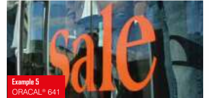
Example 5 ORACAL® 641

Yumuşak PVC folyo (75 mikron) 59 parlak + 59 mat renk Kesim makineleri ile ideal uyum Kısa ve orta vadeli işaretlemeler, yazı ve dekoratif şekiller için ideal Poliakrilat, kalıcı