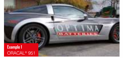
Example 1 ORACAL® 951

Cast PVC folyo, yalnızca 50 mikron 145 parlak renk + mat siyah / mat beyaz Üstün dayanıklılık ve perçin ve oluklarda üstün boyutsal kararlılık Solvent poliakrilat, kalıcı Alman onayı: ABG (StVZO), DIN EN 13501-1 (alav almaz) Yüksek kalite araç ve toplu taşıma reklamları için ideal