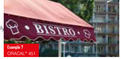
Example 7 ORACAL® 451

Üstün esneklikte, özel PVC folyo (80 mikron) 24 saten bitişli renk Kısa ve orta vadeli, branda üzeri harf ve dekoratif şekiller için ideal (branda folyo) Islak uygulama tavsiye edilir Solvent poliakrilat; kalıcı Kullanım ömrü: 3 yıl