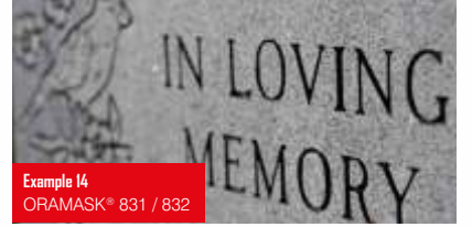
Example 14 ORAMASK® 831 / 832

Yeşil renkte şablon folyosu (PVC, 230 mikron) / Mat bitişli Cam, plastik ve tahta üzeri kumlama uygulamaları için ideal Poliakrilat, sökülebilir