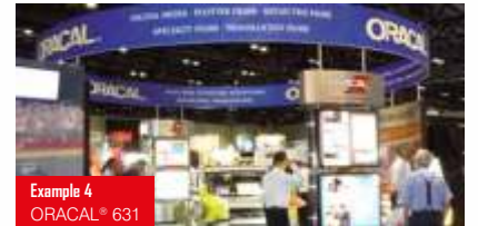
Example 4 ORACAL® 631

Yumuşak PVC folyo (80 mikron) 60 mat renk Kesim makineleri ile üstün uyum Kısa ve orta vadeli fuar alanı işaretlemeleri, yazı ve dekoratif şekiller için ideal Fuar alanlarında kullanım ömrü: 3 yıl Poliakrilat, sökülebilir Alman onayı: ORACAL® 631M: DIN EN 13501-1